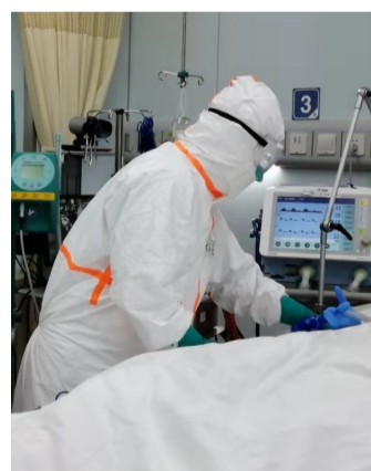
公卫中心积极救治新冠肺炎病患

疫情发生以来,上海复旦大学教育发展基金会第一时间行动起来,会同复旦大学校友会发起设立复旦大学抗击新型冠状病毒肺炎医疗基金。据统计,截至3月19日,复旦大学抗击新型冠状病毒肺炎医疗基金共收到捐赠款1024万元。该基金第一批善款用于奖励复旦大学派出的497名援鄂医疗队队员和在沪收治新冠肺炎感染者的两家市级定点医院——上海市(复旦大学附属)公共卫生临床中心和复旦大学附属儿科医院的一线医务工作者。